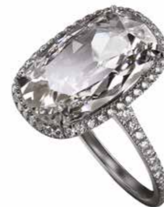
Bague Jet D'eau en fils d'or gris éthique sertis de diamants avec comme pierre de centre un diamant de 3,75 carats.

-/ Jet D'eau ring in ethical white gold wire set with diamonds, with a 3.75 carats diamond in the center.