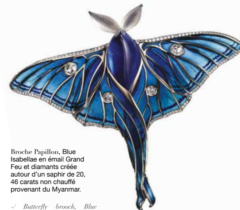
Broche Papillon, Blue Isabellae en émail Grand Feu et diamants créée autour d'un saphir de 20,46 carats non chauffé provenant du Myanmar.

So many treasures to discover absolutely, in addition to a yearly «Masterpiece». The 2018 vintage is a splendid butterfly brooch whose body is a sumptuous unheated 20.46 carats sapphire from Myanmar surrounded by Grand Feu enamel wings. A nice tribute to the ancestral know-how of the city of Geneva.