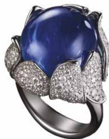
Bague Vieille-Ville mettant en scène un saphir non-chauffé du Myanmar de 25,62 carats enveloppé de pétales finement sculptés en or éthique sertis de diamants.

Autant de trésors à découvrir absolument auxquels s'ajoutera chaque année une « Masterpiece ». Le millésime 2018 étant une splendide broche en forme de papillon dont le corps n'est autre qu'un somptueux saphir de 20,46 carats non chauffé provenant du Myanmar, entouré d'ailes en émail Grand Feu. Un bel hommage au savoir-faire ancestral propre à la ville de Genève.